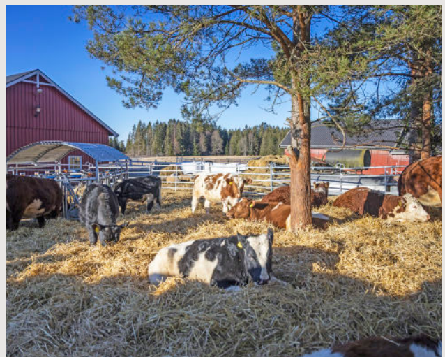
Luftegård gir større totalareal.