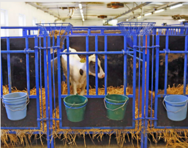
Det er vanlig å ta kalven rett etter fødselen settes i en bing.

Kyr i ammekubesetninger holdes kun for kjøttproduksjon, og melkes ikke. Der får kalvene gå sammen med moren sin i rundt et halvt år eller lengre.