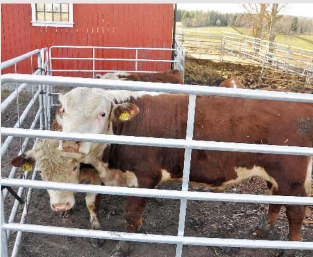
Okser setter pris på frisk luft og dagslys, også vinterstid.

I en luftegård får oksene tilgang til frisk luft og dagslys. Tilgang til luftegård innebærer også økning av det totale arealet oksene har å bevege seg på. Dette gir oksene økt mulighet for aktivitet og til å fungere sosialt sammen. 12,13