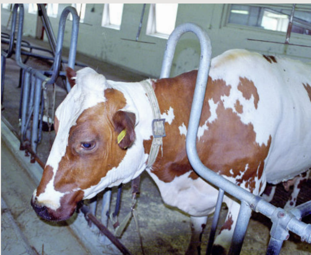
Det er tillatt å la båskyr være bundet opptil 10 måneder i året.

Også på økologiske gårder er det tillatt med båsfjøs for kyr. Det er da krav om at de har tilgang til utearealer (typisk får tilbringe litt tid i luftegård) minst to ganger i uken. 9 Det er ikke dokumentert at såpass lite bevegelse gir velferdseffekt.