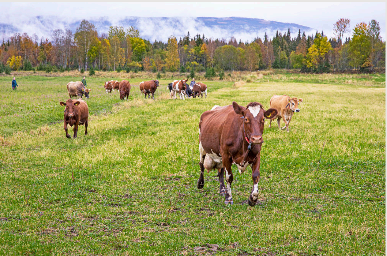
Lang beiteperiode gir utløp for viktige behov, og er spesielt viktig for båskyr.

Det er mulig for bonden å søke beitetilskudd for gårder der kyrne er på beite minst tre måneder (arealsone 5-7) eller fire måneder (arealsone 1-4). 11