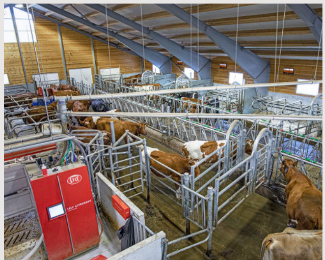
I løsdrift kan kua mosjonere, stelle seg, og kommunisere fritt med andre kyr.